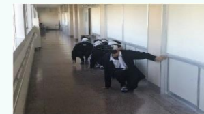
火災避難時の視界を体験

2020年度、2021年度に、実践的防災訓練として、火災避難時の視界を体験するとともに、津波を想定したAR（拡張現実）訓練を実施。