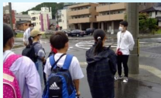
フィールドワークの様子

釜石中学校では、「助けられる人」から「助ける人」への防災教育として被災者を出さないことを目的とし、全校生、全教員、地域と連携して安否札を校区内に配布する等の取組を行っている。2022年度はこれまでの東日本大震災伝承本『このたねとばそ』の刊行にチャレンジ。