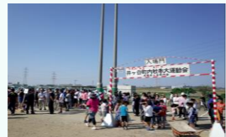
防災運動会の様子

教員養成大学の学生が、防災運動会や、大学キャンパス内のウォーキングなど町内会の行事への参加。また、地域住民の方々にも、指定避難所である大学キャンパス内の防災設備の確認などを通して、地域全体の防災意識を高める機会を提供。