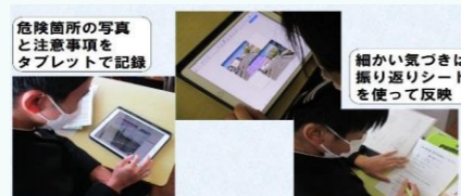
危険箇所の写真と注意事項をタブレットで記録